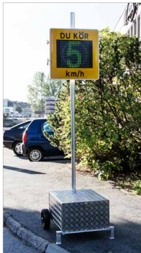
Portabel display med batterivagn.

Hastighetsdisplayen kan levereras med inbyggda batterier, solcellspanel, 230 volts nätaggregat eller som portabel display med batterivagn.